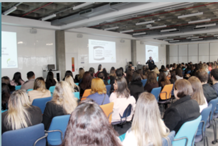
Durante evento realizado na Unisinos, em Porto Alegre (RS), notários e colaboradores puderam fazer perguntas e trocar conhecimento