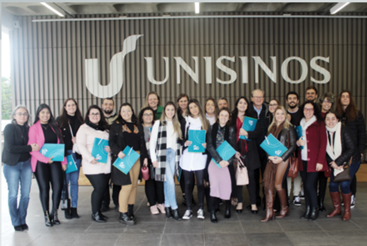
Participantes puderam debater sobre pacto antenupcial, inventários simultâneos e a Lei Geral de Proteção de Dados Pessoais (LGPD)

Sobre a importância do tabelião, o advogado apontou que esses profissionais são revestidos de fé pública, auxiliam o Estado no cumprimento das leis e fiscalização dos impostos. "O tabelião substitui o Estado com uma celeridade muito maior e com a mesma fé pública do Estado. E aí eu falo para todos os colegas se conscientizarem que tabeliães e advogados trabalham de mãos dadas. O melhor amigo do advogado que trabalha com Direito Imobiliário é o tabelião".