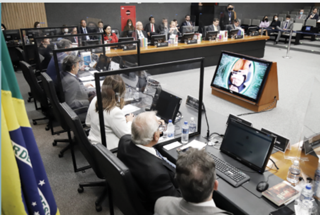
Membros da diretoria e presidentes das seccionais estaduais acompanharam o lançamento presencialmente

Módulo de Reconhecimento de Assinatura Eletrônica completa leque de serviços digitais que podem ser realizados pelo e-Notariado