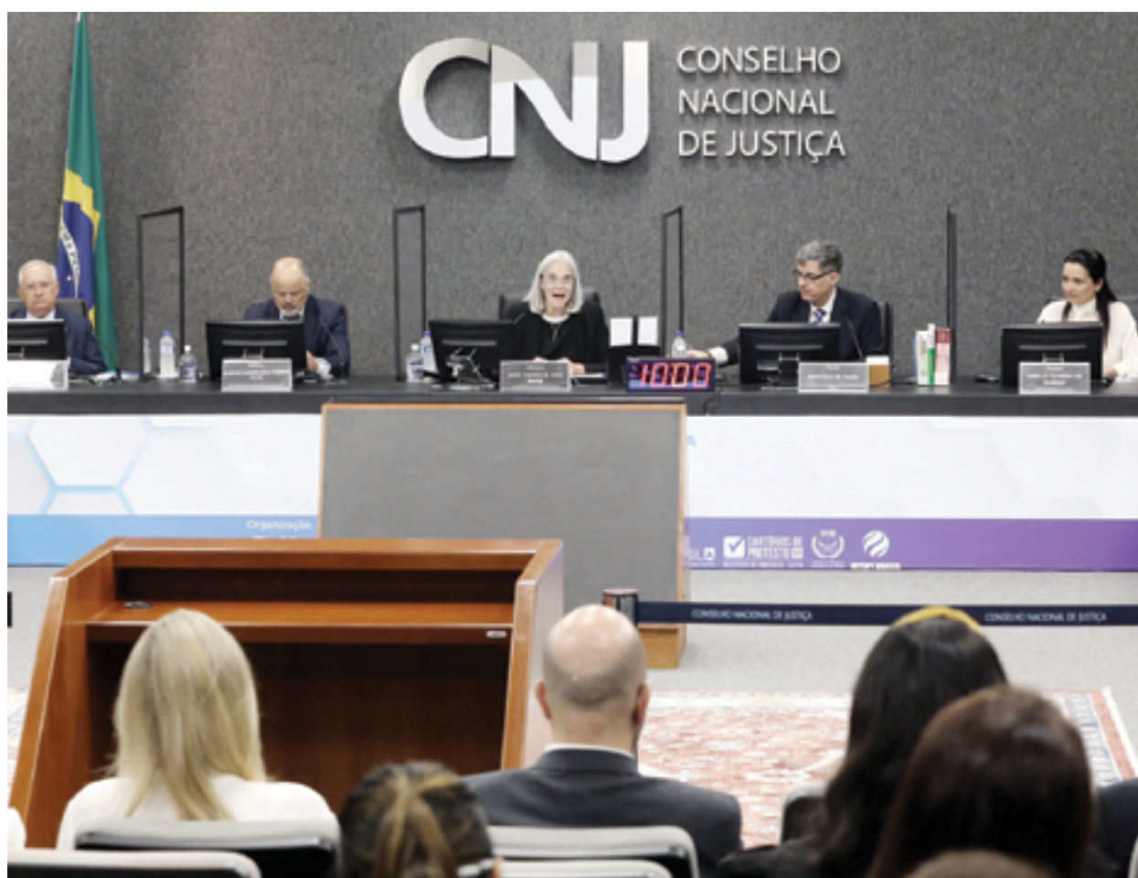
A corregedora nacional de Justiça, ministra Maria Thereza de Assis Moura, participou da mesa de abertura do evento e comentou a importância do Apostilamento Eletrônico

Encontro apresentou as inovações do serviço virtual em um debate sobre o cenário atual da Apostila no País e o desenvolvimento da segurança jurídica além-fronteiras