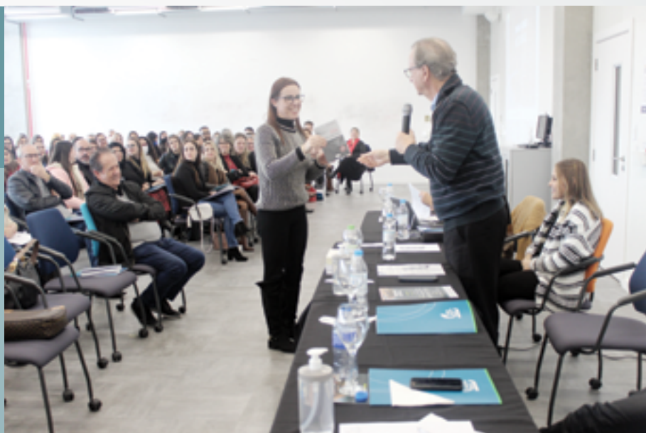
Ao final do encontro, livros relevantes sobre a atividade extrajudicial foram sorteados entre os participantes